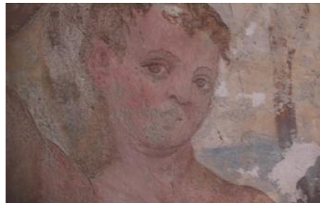
Particolare fase di ritocco pittorico

L'abside è stata oggetto di massiccio intervento di manutenzione che ne ha compromesso la decorazione interna: è presente sul lato destro un lacerto di affresco raffigurante San Sebastiano e San Michele Arcangelo (rinvenuto dopo intervento di discialbo). In corrispondenza dell'affresco si è intervenuti con impacchi di polpa di cellulosa imbevibile di alcool etilico, per il rigonfiamento della pellicola soprammessa, e azione meccanica a bisturi per l'asportazione della stessa.