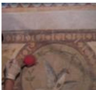
Particolari di ritocco pittorico

La decorazione a graffito dell'abside centrale e laterale risultava disomogenea dopo la pulitura, in accordo con DL e Soprintendenza, si è riproposta continuità di lettura con ricostruzioni localizzate: intonaco di calce, sabbia e polvere di marmo bianco Verona, riporto del disegno a embrici e graffiatura.