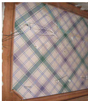
Visione d'insieme di uno dei soffitti in cui sono visibili i ganci metallici

Il consolidamento delle deformazioni è stato eseguito con malta da iniezione; per la riadesione delle parti è stato necessario rimuovere i lacerti deformati per ricollocarli con resina bi componente.