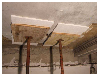
Puntelli di sicurezza

Nel soffitto dell'ambiente 6 ha ceduto una delle travi portanti, con conseguente rilassamento della struttura ad incannucciato, che risultava parzialmente ancorata e fortemente deformata. Dopo aver asportato ragnatele e polvere, eliminato i ganci e stuccato crepe e lacune, si è applicato un bendaggio di sostegno e protezione su tutta la parte ad intonaco che rivestiva la trave e sono state consolidate tutte le parti in fase di distacco. Quindi è stato eseguito il salva bordo perimetrale.