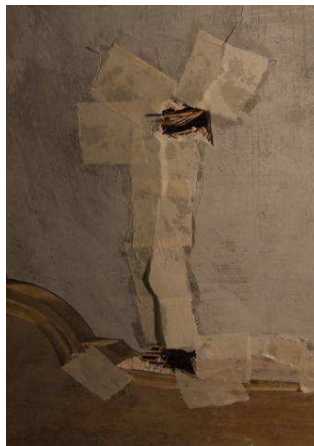
Bendaggio con ciclobdecano