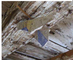
Lacerti in pericolo di caduta

I lacerti di intonaco presenti sui travetti ed in pericolo di caduta, sono stati fatti riaderire con resina bi componente e successivo salvabordo.