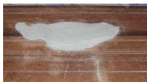
Stuccatura con rete