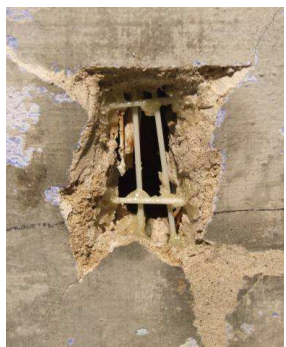
Sostegni in vetroresina