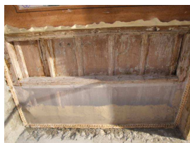
Tela sintetica protettiva

In uno dei soffitti lignei vi erano resti di un rivestimento di carta su tela a finto legno e di un bordo in carta con decorazioni ad ovuli lungo il perimetro. Quelli non più riposizionabili, su indicazione della D.L., sono stati rimossi ed archiviati, gli altri sono stati fissati. Il lacerto di maggiori dimensioni è stato messo in sicurezza con fissaggio perimetrale di una tela sintetica di protezione, a trama fitta ed ignifuga.