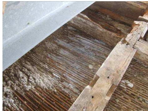
Fase di consolidamento