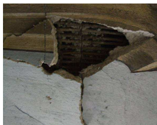
Area deformata e lesionata, da cui si vede la struttura portante ad incannucciato