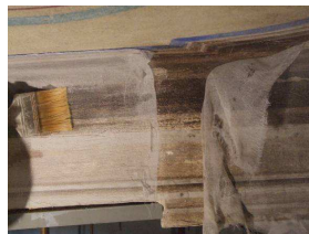
← Eliminazione bende

Dopo il rialzamento della trave si sono asportate le bende di protezione, si sono consolidate le fessurazioni, stuccate le crepe e microcrepe ed eseguito il salvabordo lungo i tagli eseguiti per l'inserimento delle travi di sostegno.