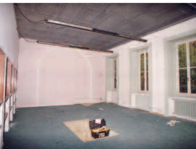
Sala Grande prima dell'intervento

Soffitti cassettonati dipinti, con lacunari monocromi nei toni dei grigi su fondo a intonaco, con decorazioni a tempera dalle linee sinuose, motivi floreali e a ovuli