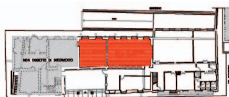
Ridisegno di una planimetria storica della villa redatta nel 1921 in cui è ancora presente l'impianto settecentesco