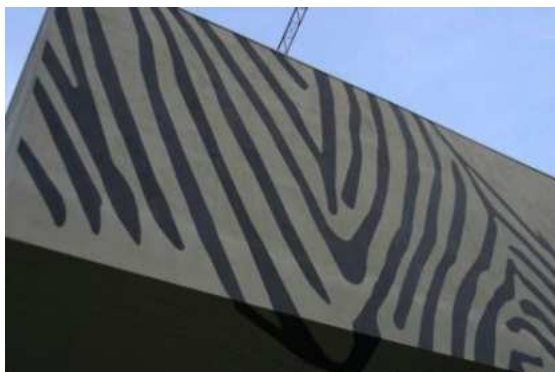
In fase di esecu- zione