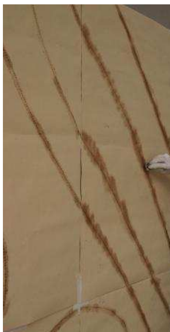
Riporto del disegno