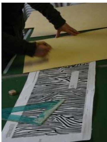
Preparazione degli spolveri